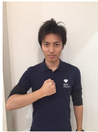
かばら (NFスタッフ) ・体幹 ・コンディショニング ・ストレッチ ・ダンス