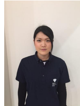
しのへ (NFスタッフ) ・ヒップホップ ・ガールズヒップホップ