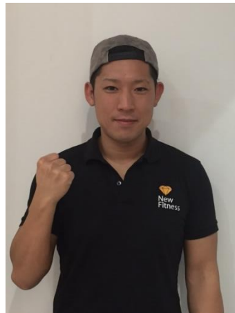
まつおか (NFスタッフ) ・ボディメイク ・ワークアウト ・VIP RPT