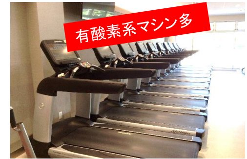
有酸素系マシン多